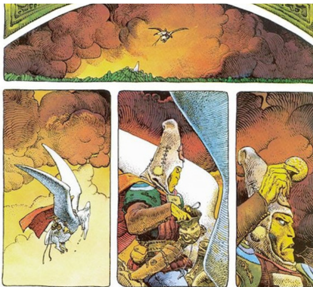
Arzach di Moebius, ©Les Humanoïdes Associés - 1976