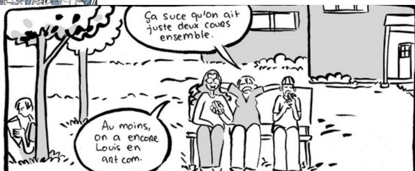
Glorieux printemps T1 di Sophie Bédard, ©Pow Pow 2012

Esempio di situazione informale in una scena quotidiana della vita di giovani.