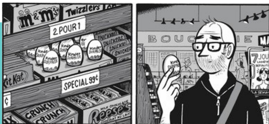
Paul à la maison di Michel Rabagliati, ©Pastèque 2020

Il per testo , costituito dai manifesti pubblicitari o dai nomi dei negozi o di prodotti, permette di ricostruire l'atmosfera di un luogo e di un'epoca, lavorando sulle competenze socioculturali.