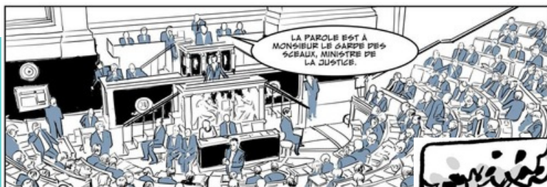
L'Abolition di Bardiaux-Vaiente e Kerfriden, © Glénat 2019

Esempio di situazione formale nella biografia di un personaggio storico ; qui il ministro della giustizia interviene in parlamento.